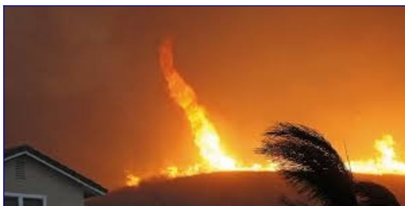
Pour la science