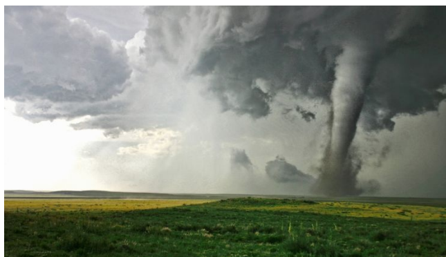
Sciences et Avenir