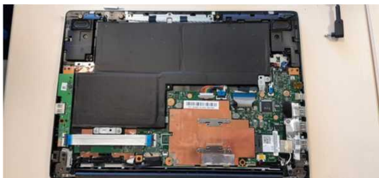
Réparation d'un ordinateur portable