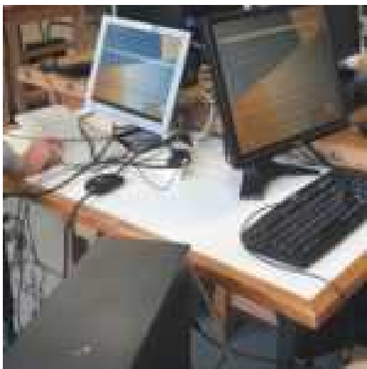
Installation d'emmbuntus sur de vieux Ordinateurs.

En plus, vous apprendrez à réparer et améliorer votre ordinateur et cela vous évitera peut-être de le jeter inutilement.